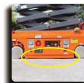
自动坑洞保护系统